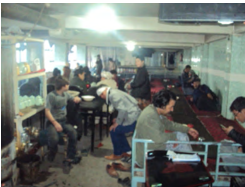
Gemeinschaftlicher Essens- und Schlafraum in Restaurant

In privat organisierten Verstecken bezahlen Betroffene oft nicht nur die Miete, sondern auch dafür, nicht veratet zu werden. So gibt es zwar regulär gemietete Wohnungen ortsabhängig ab 5000Afn/53,20€ im Monat. 235 Abgeschobene müssen jedoch teils sogar bei engen Verwandten, die eigenen Wohnraum besitzen, bis zu 8000Afn/85,20€ pro Monat Miete für ein Zimmer zahlen und mitunter wird gefordert, dass sie die Miete der gesamten Familie tragen, um selber bleiben zu dürfen. Unter den Abgeschobenen waren das bisher bis zu 300€. Bei Vermietern von Verstecken, die in keiner engen Beziehung zum Abgeschobenen stehen, sind die geforderten Beträge oft um ein Vielfaches höher. Grundsätzlich steigen die Kosten je fremder und ortsunkundiger Betroffene sind, und je auffälliger der Aufenthalt in Europa aufgrund des Auftretens oder des Kontaktes mit Ausländern ist.