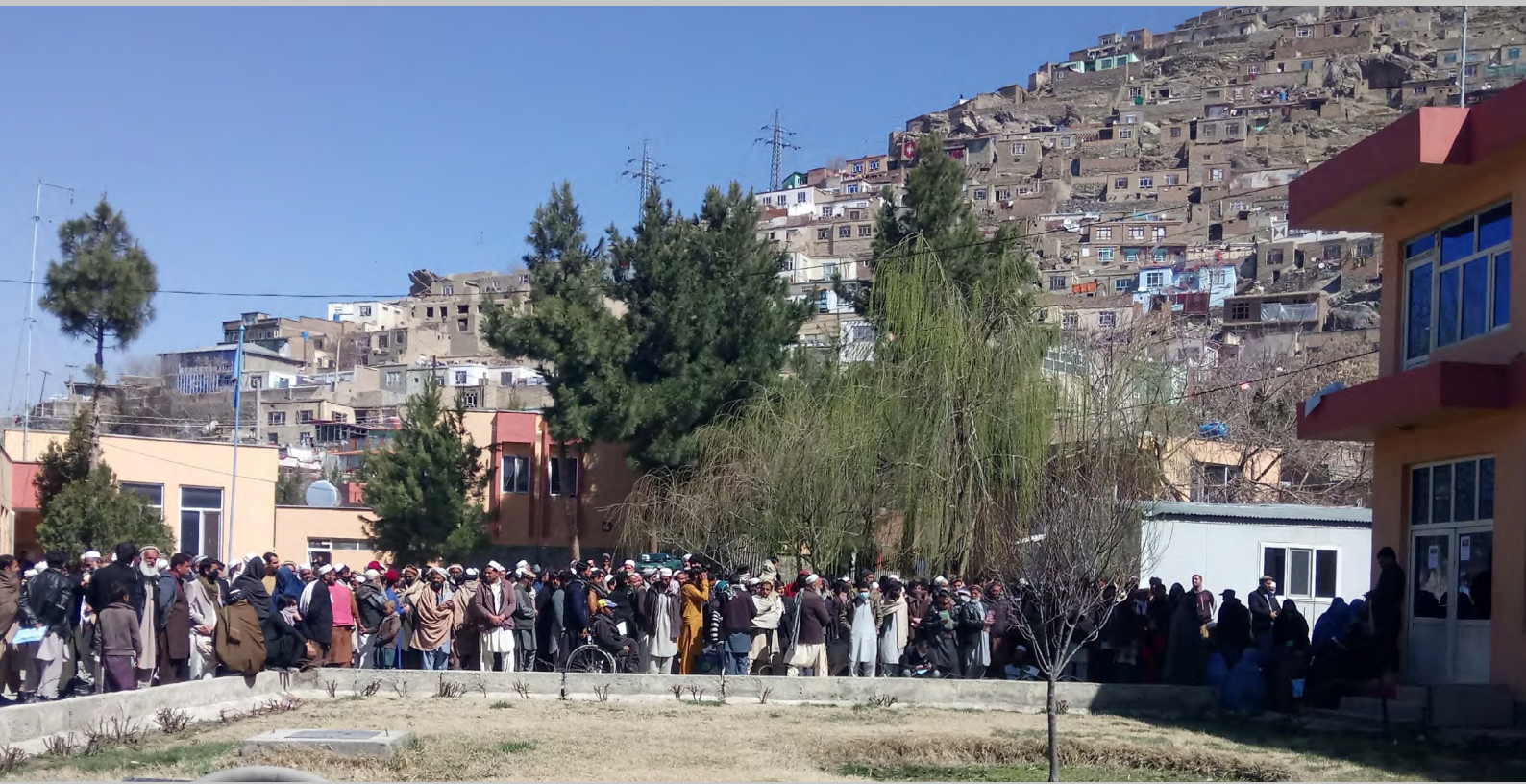
Delegation Binnenvertriebener im MoRR mit einer Petition für eine Landzuteilung – kurz bevor sie mit Stockschlägen vom Gelände gejagt wurden. Kabul, 2020.