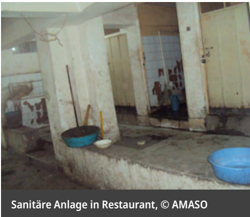
Sanitäre Anlage in Restaurant

Infolge der Corona-Pandemie haben nicht nur viele ihre Unterkünfte verloren, weil diese zeitweise schließen mussten. Abgeschobene berichteten, dass ihnen auch nach dem zeitweisen Lockdown aufgrund von Erkältungserkrankungen, die mangels Testmöglichkeiten als Corona interpretiert wurden, Unterkünfte verweigert oder entzogen wurden. Das betraf sowohl Unterkünfte bei Verwandten oder Bekannten als auch in geteilten Zimmern. Abgesehen von Hotelzimmern muss grundsätzlich davon ausgegangen werden, dass keine Chance auf soziale Distanz und sauberes Wasser besteht. 237 In geteilten Zimmern und auch in Restaurants kann schon allein auf den somit mehr oder weniger öffentlichen Sanitäranlagen nicht davon ausgegangen werden, dass eine Chance auf einfache Körperhygiene besteht.