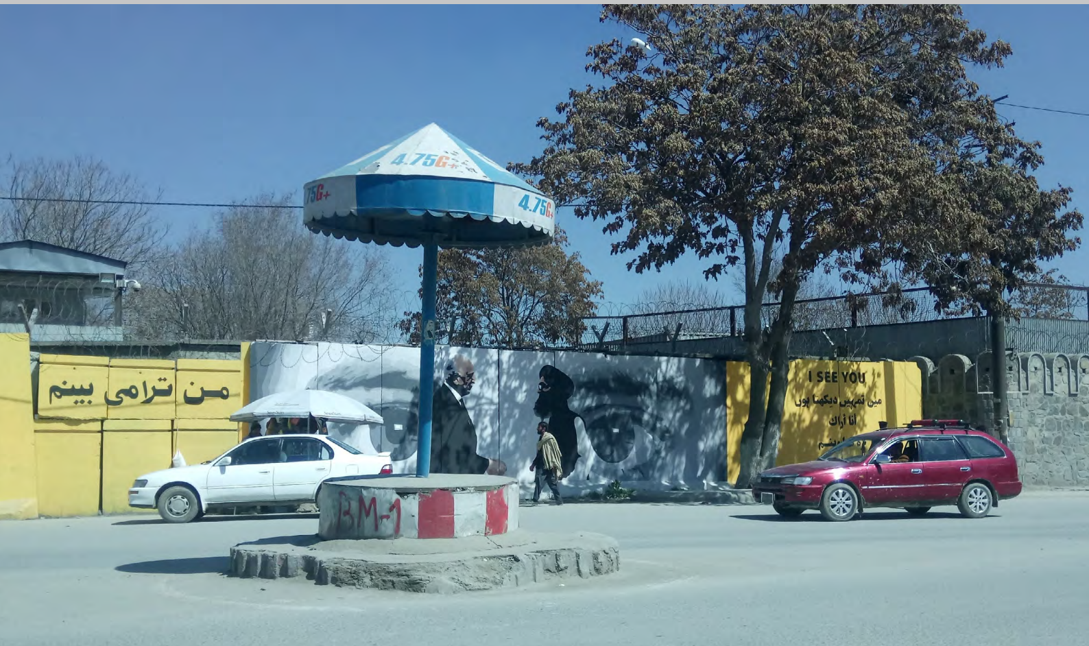
StreetArt des Künstlerkollektivs ArtLords. Handschlag zwischen Zalmay Khalilzad und Mullah Baradar, den Unterhändlern des USA-Taliban Abkommens im Februar 2020 – genau beobachtet von der Zivilgesellschaft ohne Mitspracherecht. Kabul, 2020.