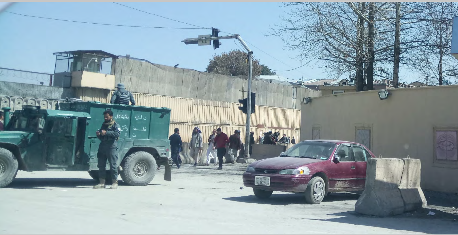
Schutzvorkehrungen Kabul Innenstadt, 2020.