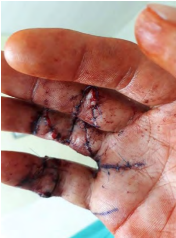
Handverletzung kurz vor Abschiebung.

Der oft akute Bedarf Abgeschobener an medizinischer Versorgung hat mehrere Gründe. So werden oft Behandlungsbedürftige abgeschoben. Es gibt zwar nach Aussage eines Mitarbeiters des MoRR eine Absprache zwischen der deutschen Bundesregierung und dem MoRR, dass schwer Kranke nicht abgeschoben und im